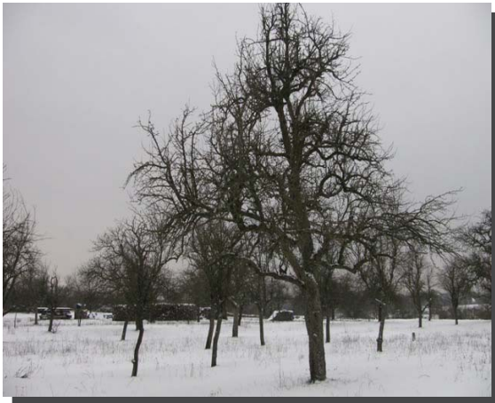
Winter in den Streuobstwiesen

Die einzigartige vielfältige Kulturlandschaft um Büchelberg ist von Streuobstbeständen von hoher Alters- und Strukturvielfalt geprägt. Vorwiegend im Westen der Ortslage sind noch großflächig erhaltene Streuobstwiesen die im Hinblick auf das Spektrum der Tierarten von großer Bedeutung sind.