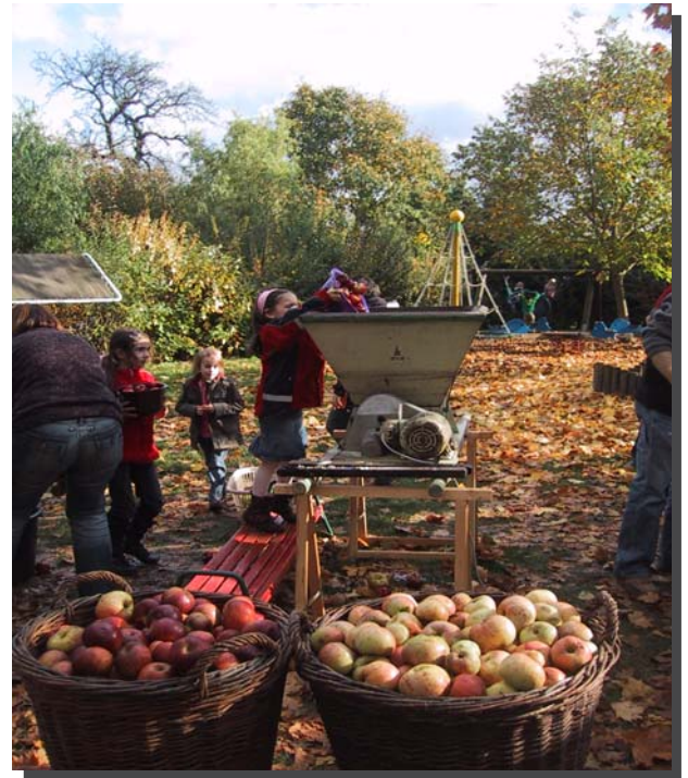
Kelteraktion im Kindergarten

Dieses Geschmackerlebnis und das Klack-Klack-Geräusch einer Obstkelter konnten die Kinder und Eltern bei der gemeinsamen Kelteraktion am 08.10.2010 im Kindergarten in Büchelberg kennen lernen.